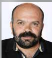
ΠΑΠΑΔΑΚΗΣ ΑΓΑΘΑΓΓΕΛΟΣ - ΣΤΡΑΤΗΓΟΣ